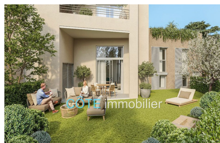
Programme neuf - Convention milancip - MLS Côte d'Azur