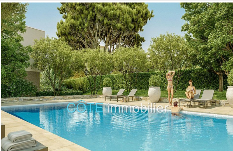
Programme neuf - Convention milancip - MLS Côte d'Azur